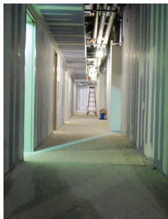
ARDEX Choice Contractor™ E.F. Marburger - Fishers, IN